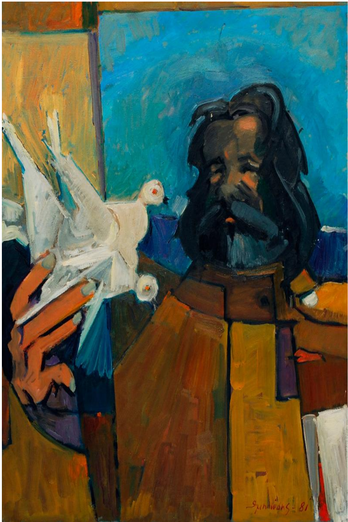
Πόλεμος και ειρήνη, του Θέμη Μηλώση, Μουσείο Σύγχρονης Τέχνης Φλώρινας